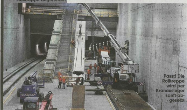
Passt! Die Rolltreppe wird per Kran ausleger sanft abgesetzt