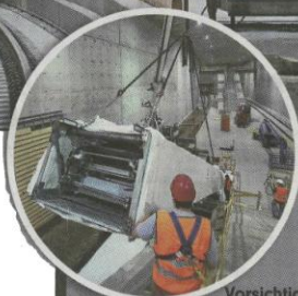
Vorsicht! werden die Teile der Rolltreppe angehoben

Der Zeitplan steht und soll unbedingt gehalten werden. Ingartinger: „Wir liegen gut im Rennen, fangen jetzt an, die Fassaden in den Stationen zu gestalten. Die Station am Markt wird mit bräunlichen Terracotta-Platten verkleidet. Die ersten sind schon an der Wand. An der Station am Wilhelm-Leuschner-Platz laufen bereits die Malerarbeiten. Die Wände und Decken bekommen weiße und graue Farbe. Für die Verkleidung werden Glasbausteine angebracht.“