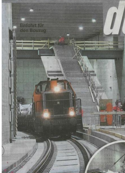
Einfahrt für den Bauzug